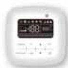
UNITÀ INTERNA - UNITÉ INTÉRIEURE - INDOOR UNIT

Filocomando optional Commande mural optional Optional wire controller