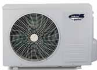
UNITÀ ESTERNA - UNITÉ EXTÉRIEURE - OUTDOOR UNIT