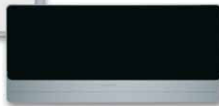
iCOOL Monoblocco a parete Mur Monobloc Monobloc wall