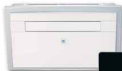
IQ Monoblocco a pavimento Plancher Monobloc Monobloc floor