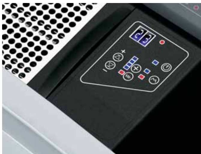
Controlli a bordo macchina (su IQ-32)